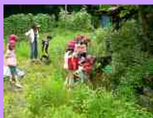
白子小の総合学習で案内