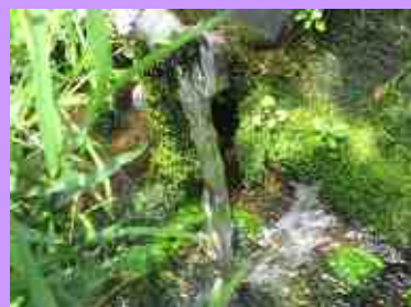
保全している富澤湧水