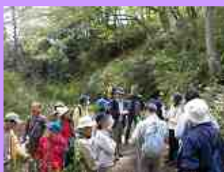
カタクリエコツアー開催