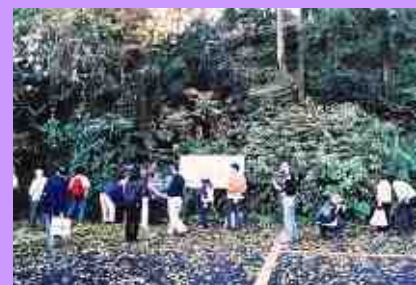
生き物の棲める環境作りと観察