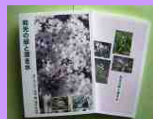
冊子『和光の緑と湧き水』出版