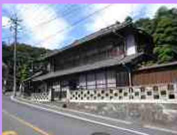
白子宿の面影が残る川越街道