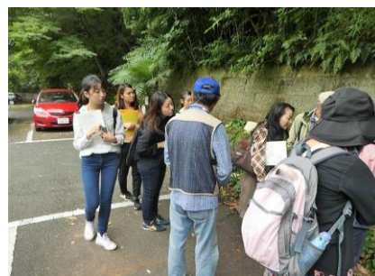
石垣湧水道での見学