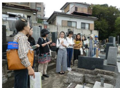
地福寺から水の力を学ぶ

地福寺——急な坂を登りきると対岸が良く観察できる。白子川の水が年月をかけて谷の地形をつくり出したのがなるほどと実感できる。