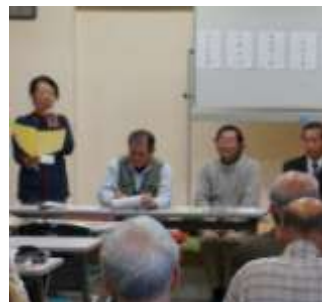
教育への活用(高橋)