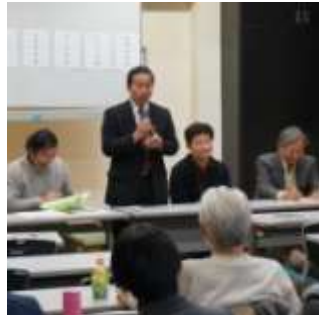
田上氏から災害時の重要性