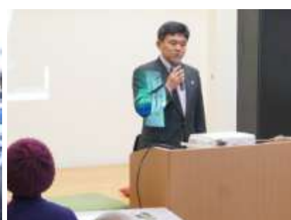
松本市長のご挨拶