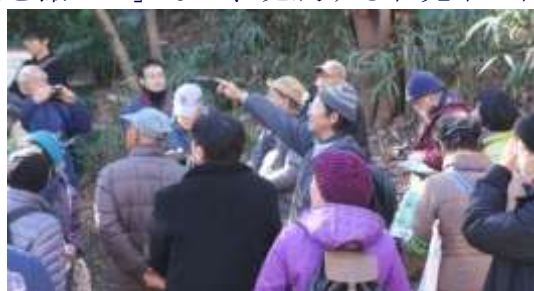
大坂ふれあいの森の地層やカタクリの説明