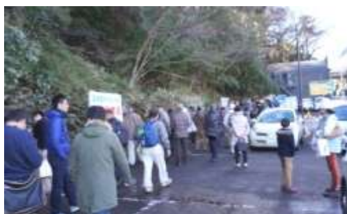
水量豊富な富澤湧水・大勢の方々の見学